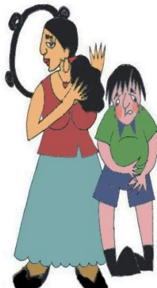
Çocuğun tıbbi gereksinimlerini göz ardı etmek