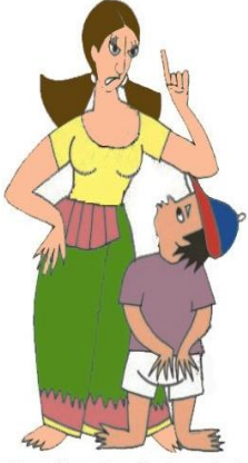
Çocuğu sözel olarak hırpalamak