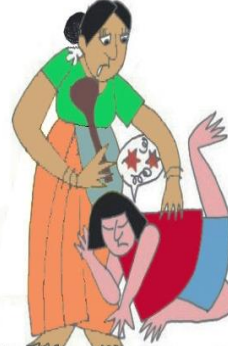
Öfkeyi, gerginliği azaltmak için çocuğu örselemek, itip kakmak