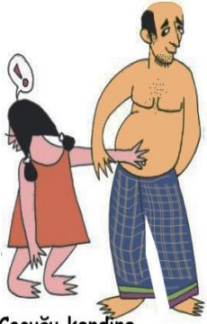
Çocuğu kendine dokunmaya zorlamak