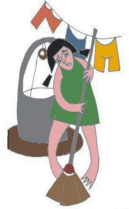
Başka işler yaptırarak çocuğun eğitim ve hobileri için kullanacağı zamanı harcamak