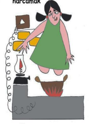
Zarar verecek durumlarda çocuğu denetimsiz bırakmak