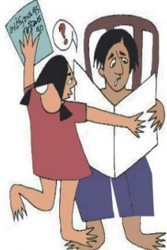
Çocuğun özgüvenini kırmak