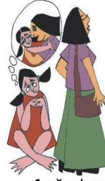
Çocuğun duygusal gereksinimlerini göz ardı etmek