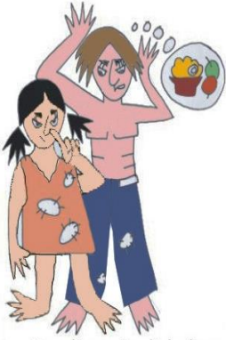
Çocuğa yeterli bakım sağlamamak, ör: Kirli, çıplak, aç bırakmak