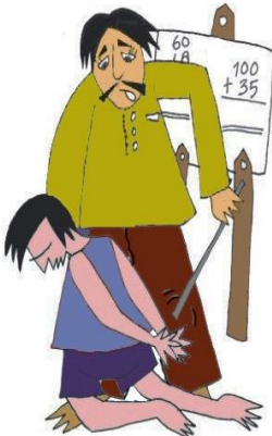
Okulda çocuğa vurmak veya aşagılamak