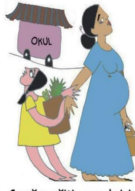
Çocuğun eğitim gereksinimlerini göz ardı etmek