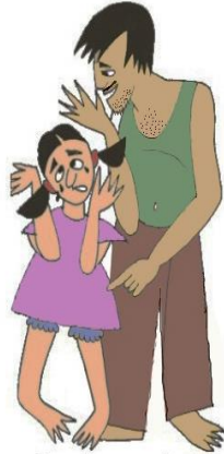
Çocuğu gereksiz yere ağlatmak