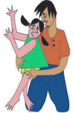
Çocuğun dokunulmasını istemediği yerlerine dokunmak