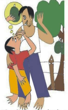
Çocuğu kendi çıkarları için kullanmak