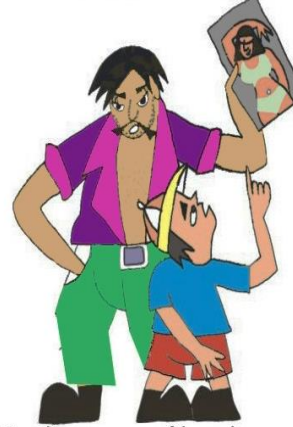
Çocuğu pornografik malzemeye veya davranışlara maruz bırakmak